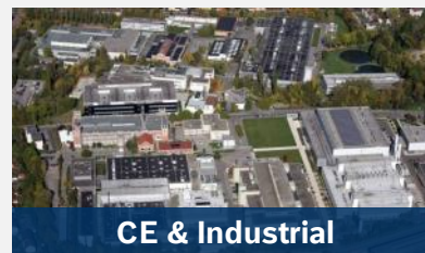
CE & Industrial